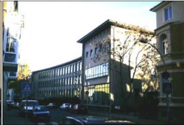
Realschule Maschstraße 2002

1957 soll in Braunschweig eine 4. Mittelschule entstehen. Zu dem Zeitpunkt existieren die Mittelschulen Augustplatz, Heydenstraße und Sidonienstraße. Die Mittelschule Augustplatz hat 963 Schülerinnen und Schüler. Zwei 5., zwei 6. und zwei 7. Klassen sollen von dieser Schule abgegeben werden und den Grundstock für die neu zu bildende Schule bilden. Untergebracht wird sie in frei gewordenen Räumen der Volksschule Pestalozzistraße. Die neue Schule trägt den Namen Mittelschule i.E. (in Entwicklung) Pestalozzistraße.