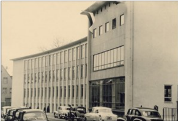
Realschule Maschstraße in den 60ern